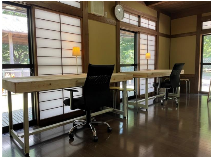
けやき公園きぼうの館 (奈良本)